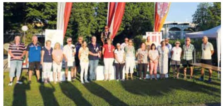
Bild rechts: Alle Medaillengewinnerinnen und -gewinner der ÖM Senioren 2021.

haben sich spannende Wettkämpfe in den einzelnen Kategorien entwickelt, die sich bis in die letzte Runde fortgesetzt haben. Die Ergebnislisten sind der Homepage www.oemgv.at zu entnehmen.