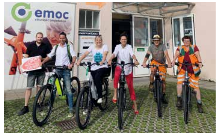
Bewegt zu Terminen: Seit Juli hat die Stadtgemeinde E-Bikes als Dienstfahrzeuge.

Übrigens: LeondingerInnen können bei „ÖÖ radelt“ ( oesterreich.radelt.at ) für ihre Stadt Rad-Kilometer sammeln und verschiedenste Preise gewinnen. Mehr dazu auf Seite 28.