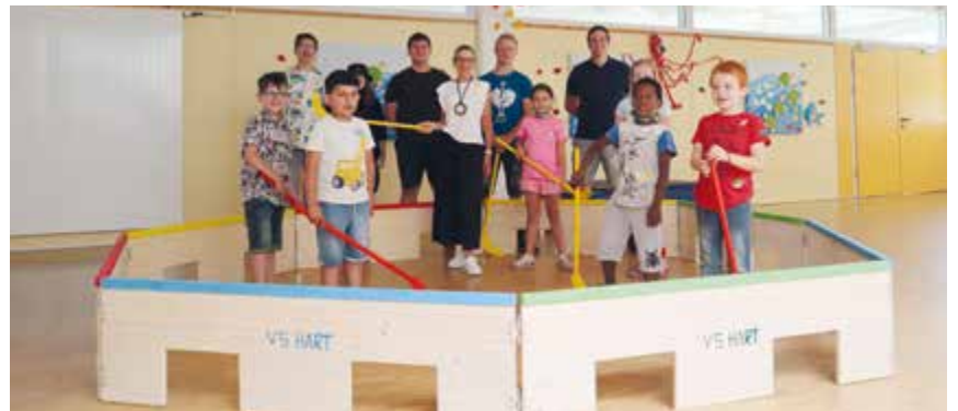
Bild rechts: Ein Hockeyfeld von den Jugendlichen der PTS für Volksschulkinder.

Die Schülerinnen und Schüler der P4-Klasse der Polytechnischen Schule Leonding überreichten den Kindern der Volksschule Hart ein variables Hockeyfeld, das auf verschiedene Arten aufgebaut werden kann. Das Projekt wurde im technischen Werkunterricht mit den Jugendlichen realisiert. Die Kinder der VS Hart und die Lehrkräfte danken herzlich für den tatkräftigen Einsatz!