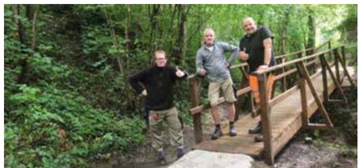
Bild rechts: Innerhalb kürzester Zeit errichteten die Tischler eine neue Brücke.

dem Stadtservice eine komplett neue Brücke. Dafür ein großes DANKESCHÖN!