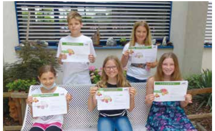
Mit Stolz zeigen die Schulkinder ihren Jausenführerschein.

Feuereifer bei der Sache, haben ein Jausentagebuch geführt, wurden von den Eltern bei der Zusammenstellung der Jause tatkräftig unterstützt und haben schließlich die Abschlussprüfung bravourös gemeistert. Zu Recht dürfen sie sich nun als junge Expertinnen und Experten für gesunde Jause nennen und sie haben dies auch in einem Jausenführerschein dokumentiert bekommen 😊