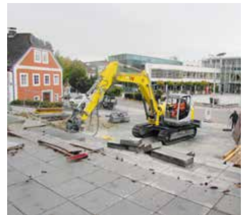
In zwei Bauabschnitten wurde das Leondinger Zentrum erneuert. Mit den Umbauarbeiten wurde im Herbst 2020 begonnen.