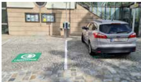
Vor der Raiffeisen Bank können nun E-Autos geladen werden.