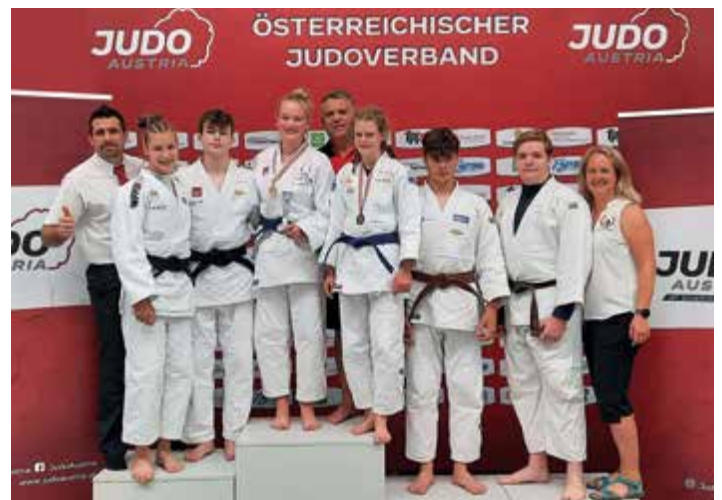
Medaillenregen für die Leofighters.

Am Tag darauf, bestätigte Waldhör ihre Form in der Altersklasse U21, wo sie sich eine zusätzliche Bronze-Medaille sichern konnte. Wir gratulieren zu diesen top Ergebnissen, die die Leofighters in einem sehr starken Starterfeld erkämpften.