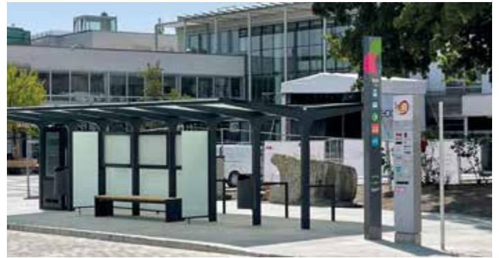
Eine moderne Haltestelle mit Radständern (dahinter) und einer digitalen Amtstafel.