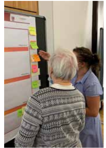
Bild rechts: Gleich zu Beginn der Infoabende wurden die Gäste nach ihrer Meinung zu verschiedenen Mobilitäts-Themen befragt.

wurden bisher erarbeitete Analysen vorgestellt. Im Zuge des Mobilitätskonzepts wurden bis Ende Juli auch Befragungen durchgeführt. Die Ergebnisse werden in einem der nächsten Gemeindebriefe bekannt gegeben.