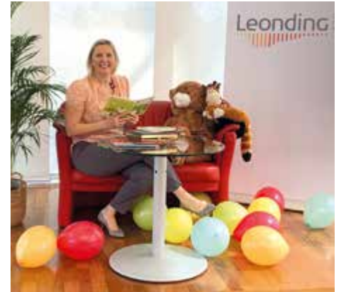
Bild rechts: Die erste Lesung der Bürgermeisterin wurde als Video aufgezeichnet, die zweite wird im Atrium stattfinden.

verstellter Stimme, zum Beispiel als Kater Findus, hören möchte, kann sich das Video am Youtube-Kanal „Leonding - Schön, hier zu leben.“ ansehen. Für etwas ältere Kinder liest die Bürgermeisterin nun am 17. September im Atrium. Einem tollen Lesevergnügen steht nichts im Wege!