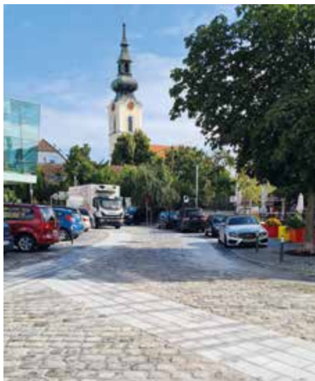
Neue Radwege für eine angenehmere Fahrt.

Offiziell eröffnet wird der neue Stadtplatz im Zuge des Stadtfestes am Freitag, 10. September um 18 Uhr auf der Festbühne.