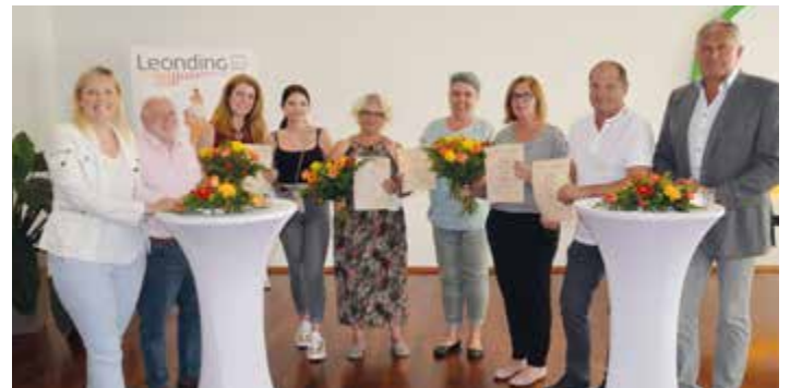
Kleine Ehrungsfeier für verdiente Persönlichkeiten im Sport.