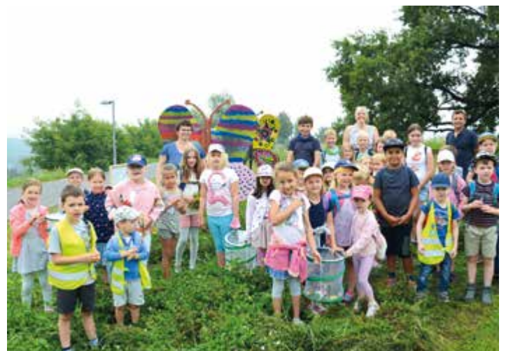
Im Juli ließen die Kinder ihre Schmetterlinge ziehen.