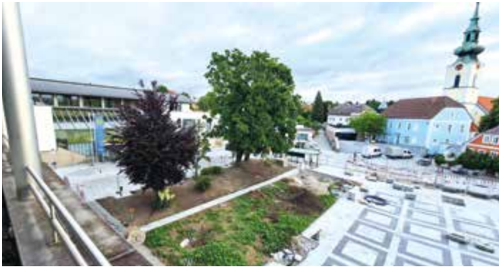
Die bestehende Grünfläche wurde erweitert und wird auch noch bepflanzt.