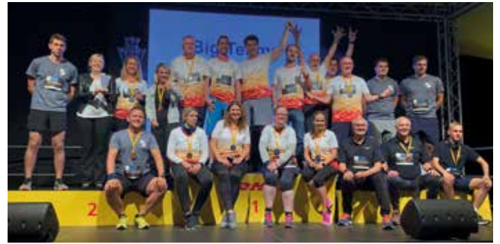
2. Platz beim „Big Team“ für die Läuferinnen und Läufer aus Leonding.

bewältigten die Fünf-Kilometerstrecke laufend oder „walkend“ (Nordic Walking). Zudem erreichte die Stadtgemeinde den zweiten Platz in der Wertung Big Team. Wir gratulieren herzlich zum Zieleinlauf!