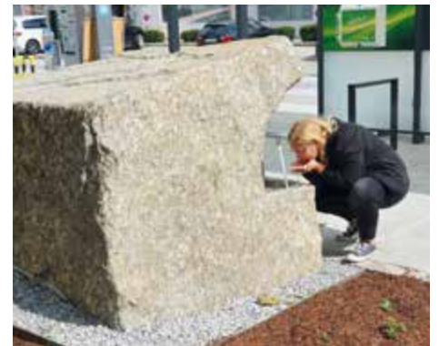
Der frühere Steinbrunnen wurde zum Trinkbrunnen.