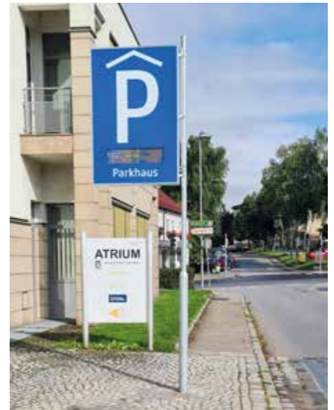
Die frei verfügbaren Parkplätze in der Tiefgarage sind nun am Stadtplatz ersichtlich.