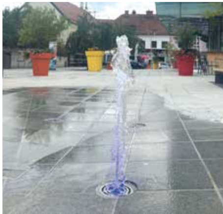
Beleuchtete Bodenfontänen für Kinder.