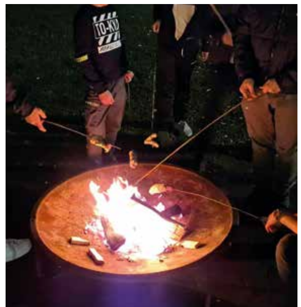
Gegrilltes vom Lagerfeuer gab es beim Jugendtag vom JUZ Plateau.

Da es in diesem Jahr keinen großen Jugendtag – gemeinsam veranstaltet von allen Leondinger Jugendeinrichtungen – gegeben hat, haben sich die Einrichtungen dafür entschieden, eine Jugendwoche zu organisieren und jeweils einen eigenen Jugendtag zu gestalten. Im JUZ Plateau gab es an diesem Tag u. a. selbstgemachtes Eis, Würstel grillen am Lagerfeuer. Musikalisch umrahmt haben den Tag die jugendlichen Gäste selbst. Gut erholt von der Sommerpause startet das Team vom Plateau am 6. September wieder mit dem offenen Betrieb.