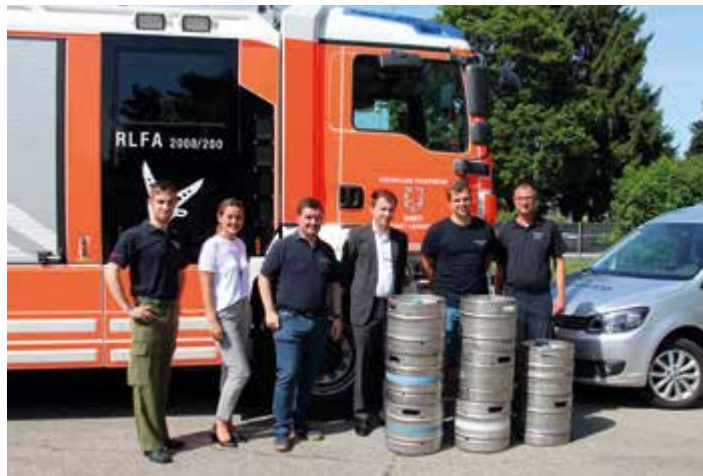
Bild rechts: Bierspende der GIWOG für die Freiwilligen Feuerwehren.

Die GIWOG dankte allen Helferinnen und Helfern mit einer Bierspende sehr herzlich.